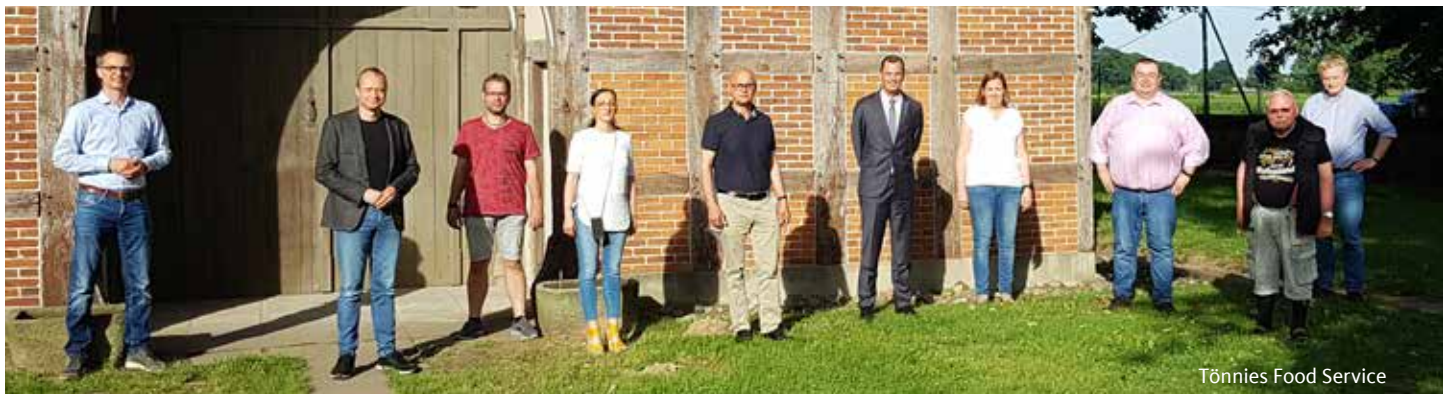
Tönnies Food Service